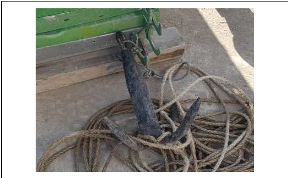
사진2. 인양에 사용된 달기구(현장제작 흑)