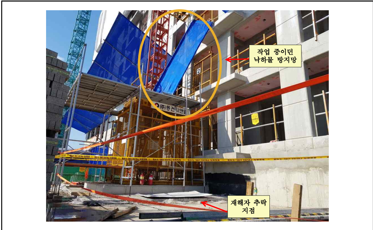
사진1. 재해자가 설치 중이던 낙하물 방지망, 재해자 추락 지점